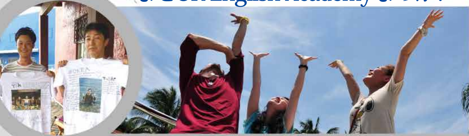
卒業生たちの体験談。

OKEAのメリットの1つは、自らが必要とする英語能力を伸ばすことができるという点です。OKEAには様々なクラスがあり、原則として個々の好きように選択することができます。またそれぞれのクラスの内容も、各先生と相談の上、自らの望む形に変更することができます。例えば、英語のビジネス文書作成能力を向上させたい場合は、Writingのクラスを英語でのビジネス文書の書き方に特化させる等です。私の場合は、仕事上で使用する英語での会話能力を向上させたかったため、なるべく、英会話力を向上させるためのクラスを選択し、また各クラスの内容についても、ビジネス事項に関する事由を重点的に取り上げるようにしています。このような融通のきくクラスにより、OKEAでは自らの好きなように英語力を向上させることができます。