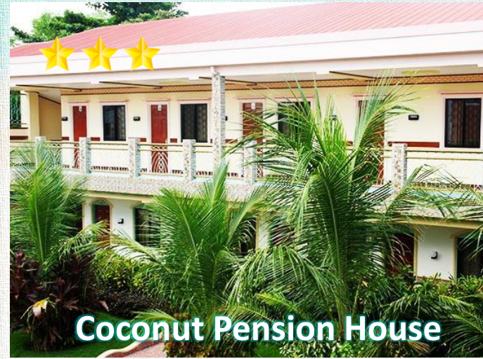
Coconut Pension House