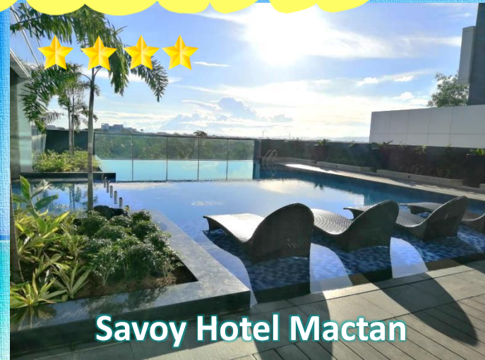
Savoy Hotel Mactan