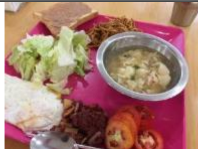
コンビーフ、スパゲティ、海鮮スープ 目玉焼き、トマト、レタス、トースト