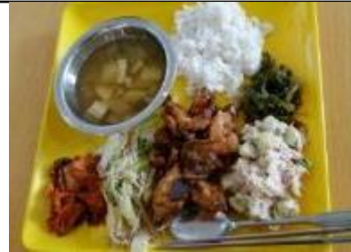
鳥の醤油炒め、ポテトサラダ、もやし和え、小松菜和え、キムチ、スープ、ライス