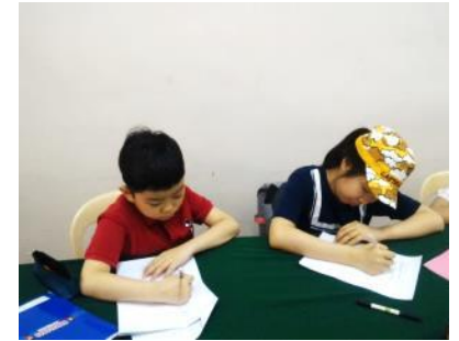
一日を振り返り 英語で日記を書きましょう