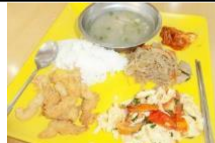
フライドチキン、卵とトマトの炒めもの、春雨、チキンスープ、キムチ、ライス