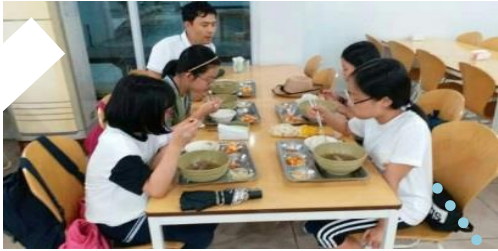
夕食をしっかり食べて 夜の学習に向けて元気をチャージ