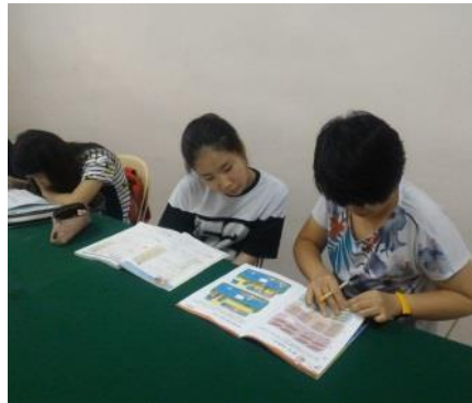
自習と宿題タイム