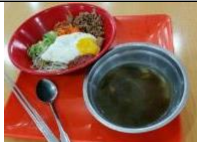
ビビンバ、わかめスープ