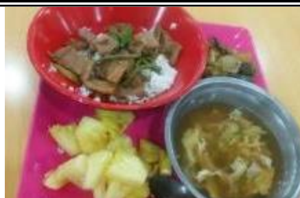
豚丼、卵スープ、肉味噌炒め パイナップル