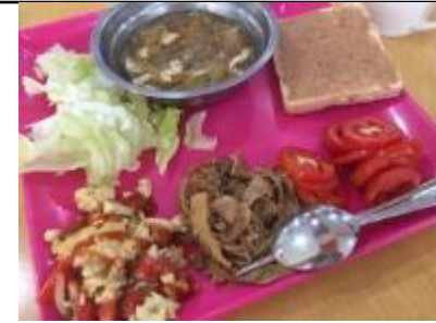
肉じゃが、春雨スープ、スクランブルエッグ トマト、レタス、トースト