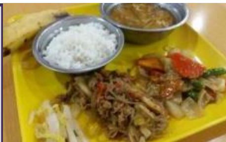
肉じゃが、八宝菜、中華スープ 白菜の浅漬け、ライス、バナナ