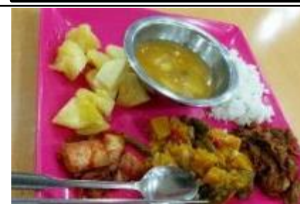
かぼちゃの煮物、肉野菜炒め、キムチ カボチャスープ、パイナップル、ライス