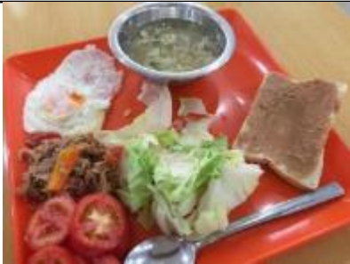
肉野菜炒め、目玉焼き、卵スープ トマト、レタス、トースト