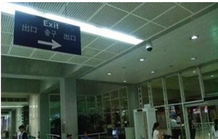
<ミーティング場所>