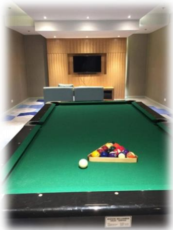
ビリヤード施設付き