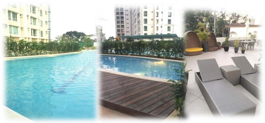
プール使い放題(子ども用プール付き)