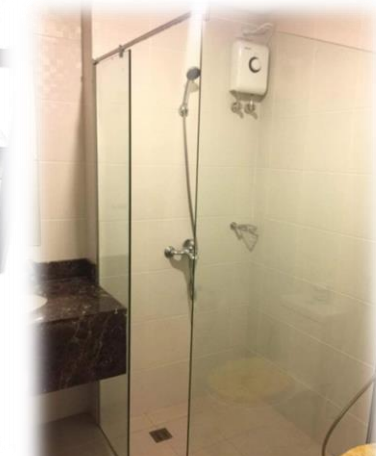
安全・清潔・おしゃれなお部屋で滞在・レッスン