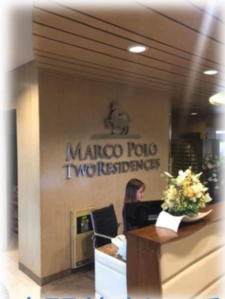
24時間体制の受付 及びセキュリティ