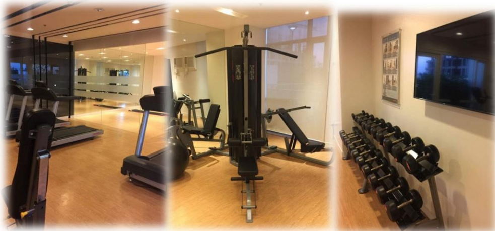
本格ジム使い放題