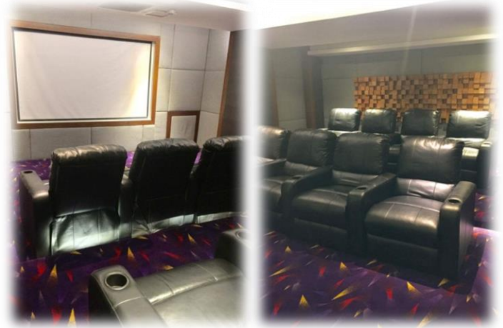
シアタールーム付き