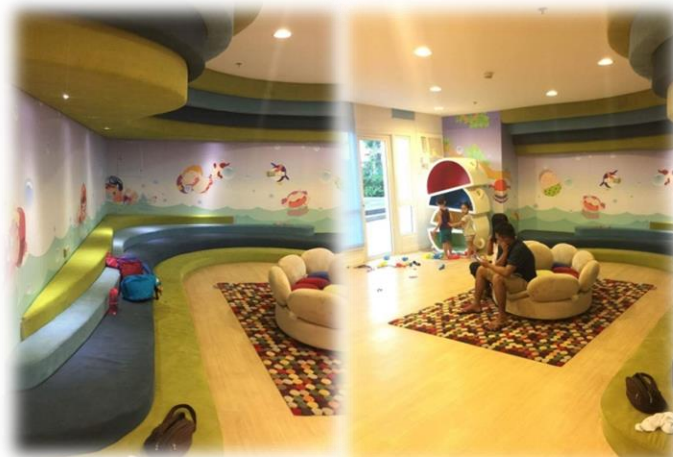
かわいいプレイルーム使い放題