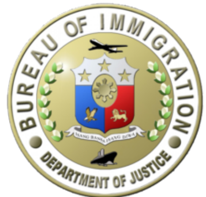
フィリピン入国管理局

フィリピンの外国人登録書です。59日間以上滞在する学生は、必ず取得しなければならず1年間は無効です。フィリピン国内では身分証明書としても利用できます。ACR-I Cardの取得手続きは当校で行います。